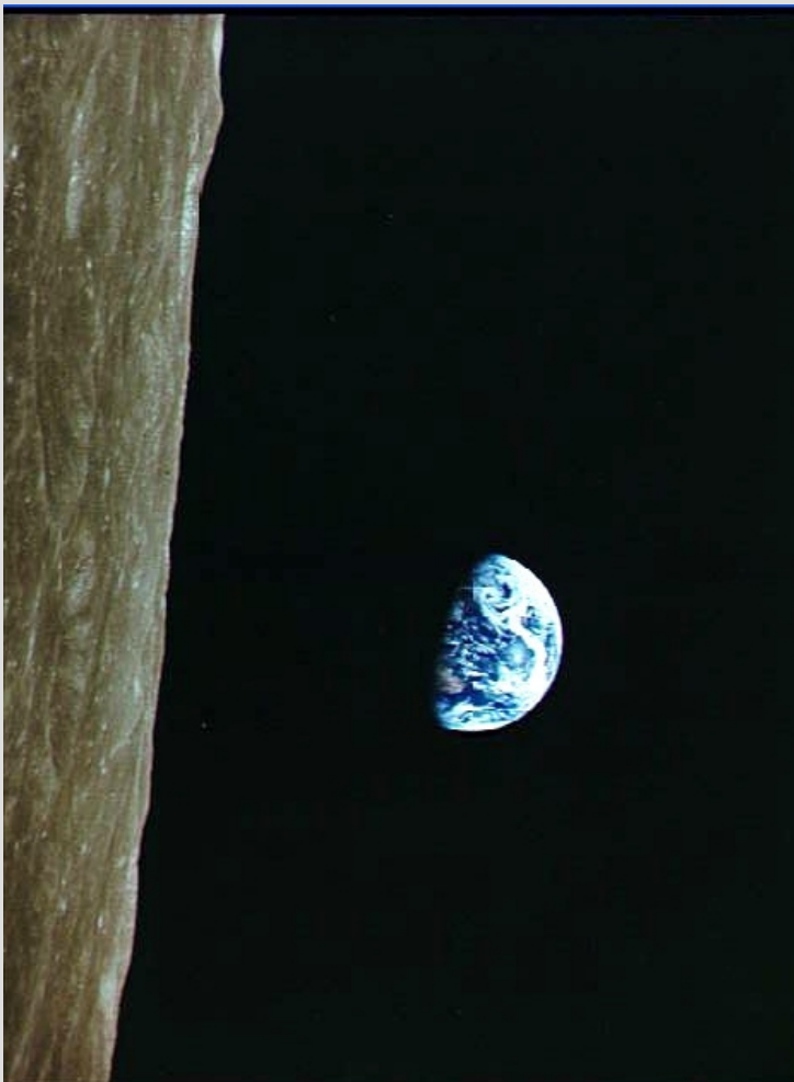
Die Erde vom Mond aus gesehen.

Der Abstand Erde-Mond entspricht etwa dem 30fachen Durchmesser der Erde.